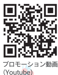
プロモーション動画 (Youtube)

2018.9.16~17 国立オリンピック記念青少年総合センターにてプレゼンターに210名が応募。 1次動画審査で38名に。 2次動画審査で12名のファイナリストが決定！ 当日は、340名の参加者を得て開催。